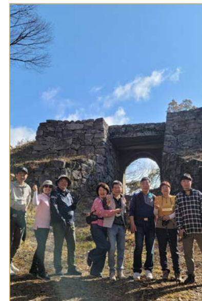
글로벌 융합회 정기 월례회