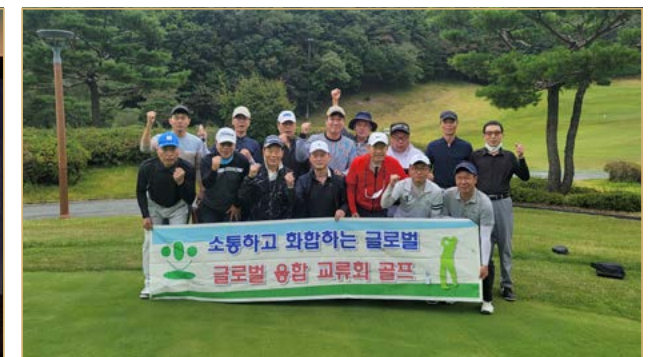
글로벌 융합회 내 골프모임