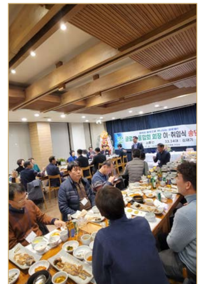
이·취임식 및 송년의 밤