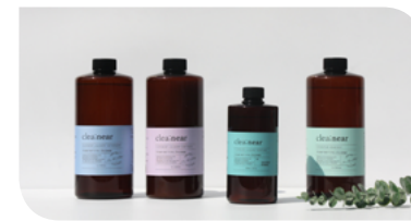
(주)디에이치 케미칼 하현주 대표와 (주)아이디어공 박정길 대표의 기술협업을 통한 친환경 제품 개발